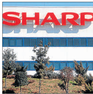
Planta de Sharp en Sant Cugat

■ Prácticamente la totalidad de la plantilla de la planta de la multinacional Sharp de Sant Cugat del Vallès secundó ayer la huelga contra los más de 180 despidos previstos por la multinacional. Unos 150 trabajadores se trasladaron desde la planta hasta el consulado japonés en Barcelona.