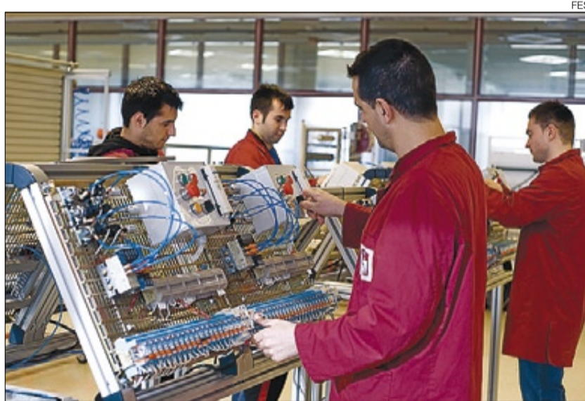
► Nuevos mecánicos ► Aula de la Fundación Eduard Soler en Ripoll.

Con el inicio del próximo curso escolar, la Fundación Eduard Soler regularizará unos estudios que ha ido configurando en los últimos años con adaptaciones y extensiones de la FP de mecánica y electrónica. Pero no es tan fácil llenar las